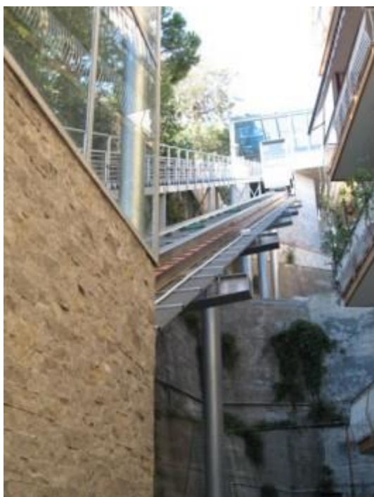
Ascensori Inclinati Imperia