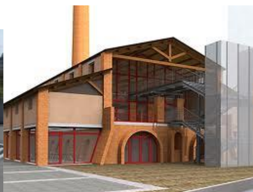
Fornace Carotta Padova