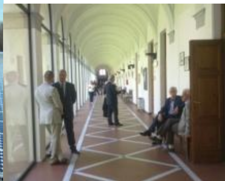
Fornace Carotta Padova